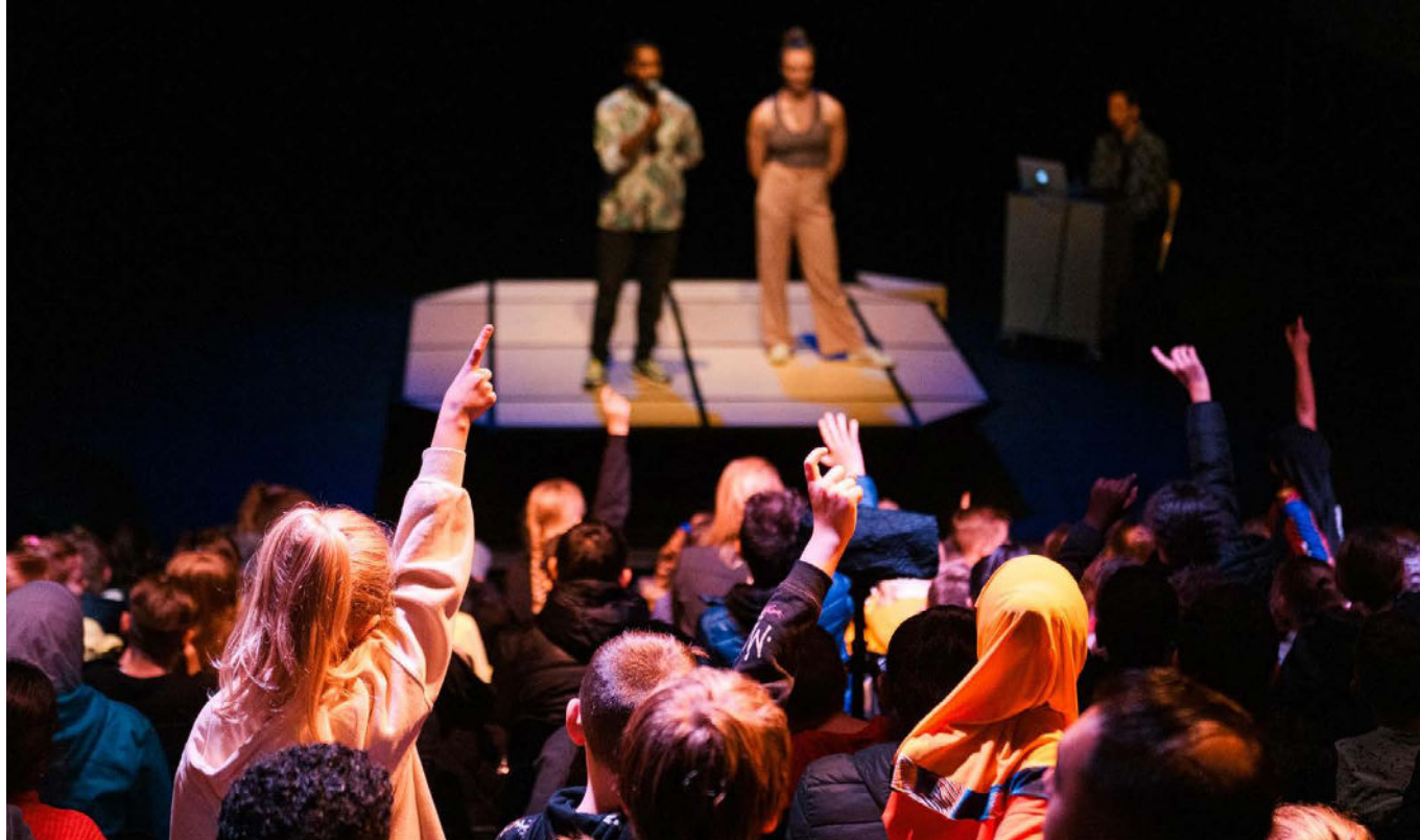
Nagesprek On The Move tijdens Festival Circolo